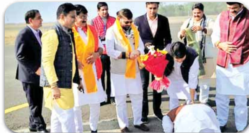
मंत्री पद की शपथ लेने के पूर्व वलियार से भाजपा विधायक प्रद्युम्न सिंह तोमर ने एयरपोर्ट पर केंद्रीय मंत्री ज्योतिरादित्य सिंधिया के पैरों में पूरी तरह झुककर प्रणाम किया।