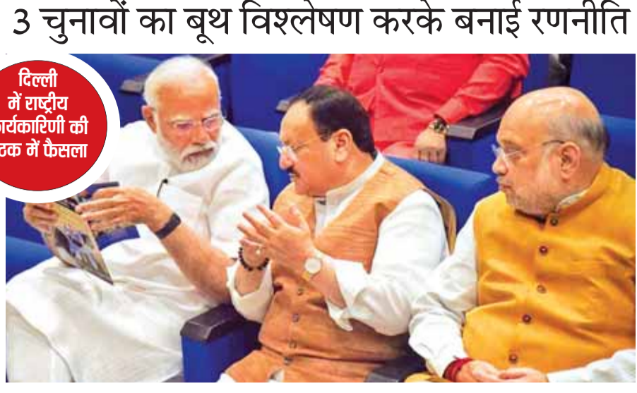
दिल्ली में राष्ट्रीय कार्यकारिणी की बैठक में फैसला

एजेसी नई दिल्ली भारतीय जनता पार्टी आगामी लोकसभा चुनावों की तैयारियों को लेकर पूरी तरह से जुट गई है। जीत की हेट्टिक लगाने के लिए भाजपा ने तैयारियों को लेकर मेगा योजना बनाई है। पार्टी की बैठक में चुनाव में बड़ी जीत दर्ज करने के लिए रणनीति बनाई गई। बड़ा झण्डा की हाल ही में राष्ट्रीय कार्यकारिणी की मीटिंग नई दिल्ली में संपन्न हुई। इसमें राज्यों में पार्टी किस तरह से चुनावी तैयारियां करेगी, इस पर बिंदुवार चर्चा की। इसके बाद खास बिंदुओं पर बात की और एजेंडा तय किया।