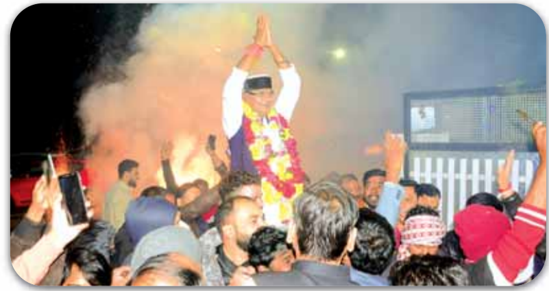
मंत्री विश्वास सारंग शपथ लेने के बाद सीधे खेड़ापति हनुमान मंदिर पहुंचे। यहां उन्होंने विधिवत पूजा अर्चना की। इसके साथ ही कार्यकर्ताओं ने ढोल-नागाड़ा से मंत्री सारंग का स्वागत किया और आतिशबाजी की।