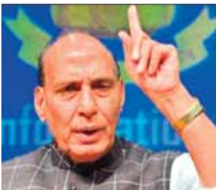
एजेसी नई दिल्ली

शनिवार को भारत आ रहे व्यापारिक जहाज पर किए गए ड्रोन हमले पर भारत के रक्षा मंत्री राजनाथ सिंह ने कड़ी प्रतिक्रिया दी है। उन्होंने कहा है कि भारत सरकार इस हमले को गंभीरता से ले रही है, जिन्होंने भी इस हमले को अंजाम दिया है उन्हें हम सागर तल से भी ढूँढ निकालेंगे। आईएनएस इंफाल, एक प्रोजेक्ट 15बी स्टील्थ गाइडेड मिसाइल विध्वंसक, को मंगलवार को नौसेना डॉकयार्ड, मुंबई में आयोजित एक समारोह में भारतीय नौसेना में शामिल किया गया। इस अवसर पर रक्षा मंत्री राजनाथ सिंह ने कहा कि आजकल समंदर में हलचल कुछ ज्यादा ही बढ़ गई है। अरब सागर में व्यापारिक जहाज (एमवी) केम प्लूटो पर हाल ही में हुए संधिगत ड्रोन हमले और लाल सागर में 'एमवी साई बाबा' पर हुए हमले पर प्रतिक्रिया देते हुए रक्षा मंत्री ने कहा कि भारत की बढ़ती आर्थिक और सामरिक शक्ति ने कुछ ताकतों में ईर्ष्या और नफरत भर दी है।