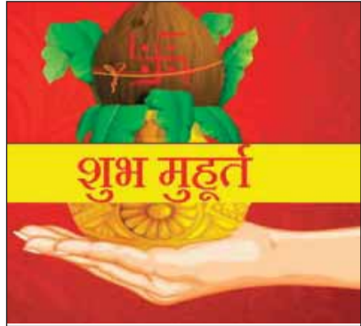
15 मार्च से खरमास भी

जारी वर्ष में अब विवाह के लिए 15 दिसंबर को ही मुहूर्त शेष है। वहीं ज्योतिष शास्त्र के मुताबिक आगामी वर्ष में 21 अप्रैल के बाद व मई-जून में विवाह के लिए कोई भी शुभ मुहूर्त नहीं है।